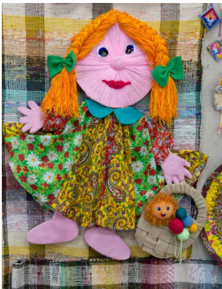
Рис. 2 Талисман мастерской «Светелка»