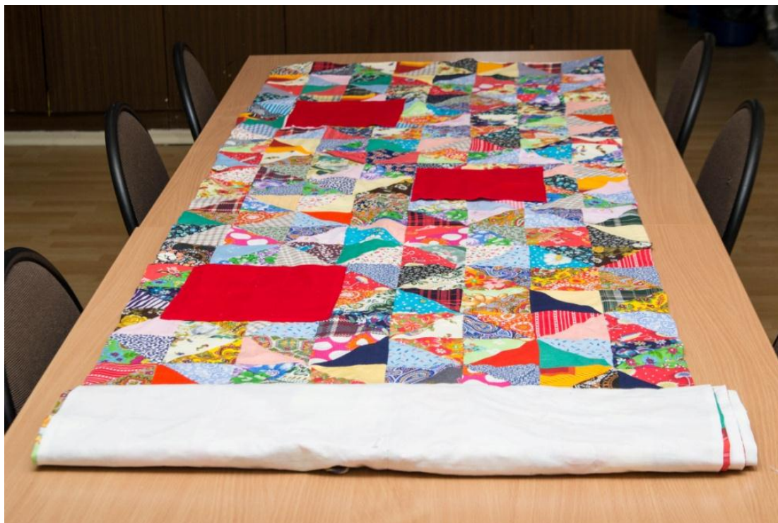
Рис. 1 Лоскутная дорожка